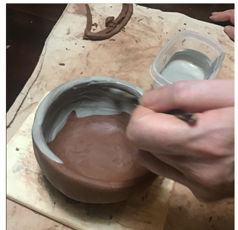
15. Coat your pot with white slip . Let it dry and add coats until there are no streaks . Pahiran ang iyong palayok ng puting slip. Hayaang matuyo at magdagdag ng mga coats hanggang sa walang mga guhitan.