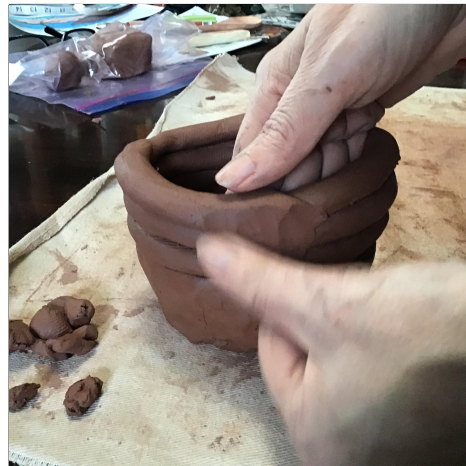
8. Smear your coils together using only one finger or one thumb. Pahiran ang iyong mga likid gamit lamang ang isang daliri o isang hinlalaki.