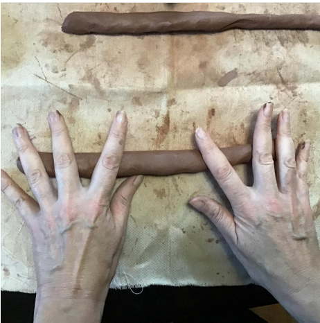
7. Stretch the coils by spreading your fingers while rolling. lunat ang mga coils sa pamamagitan ng pagkalat ng iyong mga daliri habang gumugulong.