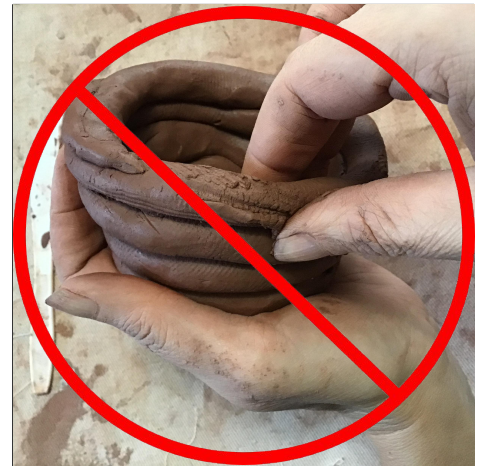
9. Don't pinch on either side because you will make your pot very dry and thin. Huwag kurutin ang magkabilang gilid dahil gagawin mong tuyo at manipis ang iyong palayok.