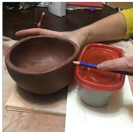
14. Scribe and then trim the lip . Sumulat at pagkatapos ay putulin ang labi.