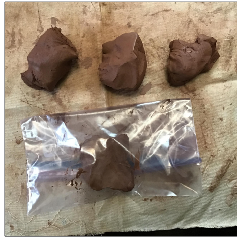
2. Divide your clay into four pieces: one for a base , two for coils , and one for everything else and for emergencies. Hatiin ang iyong luad sa apat na piraso: isa para sa isang base, dalawa para sa mga coils, at isa para sa lahat ng iba pa at para sa mga emergency.