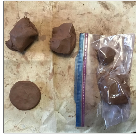
3. Make the bottom : a disc of clay that is 1-1.5 cm thick and 7-10 cm in diameter. Store any leftovers in your bag. Gawin ang ilalim: isang disc ng luad na 1-1.5 cm ang kapal at 7-10 cm ang lapad. Itago ang anumang natira sa iyong bag.